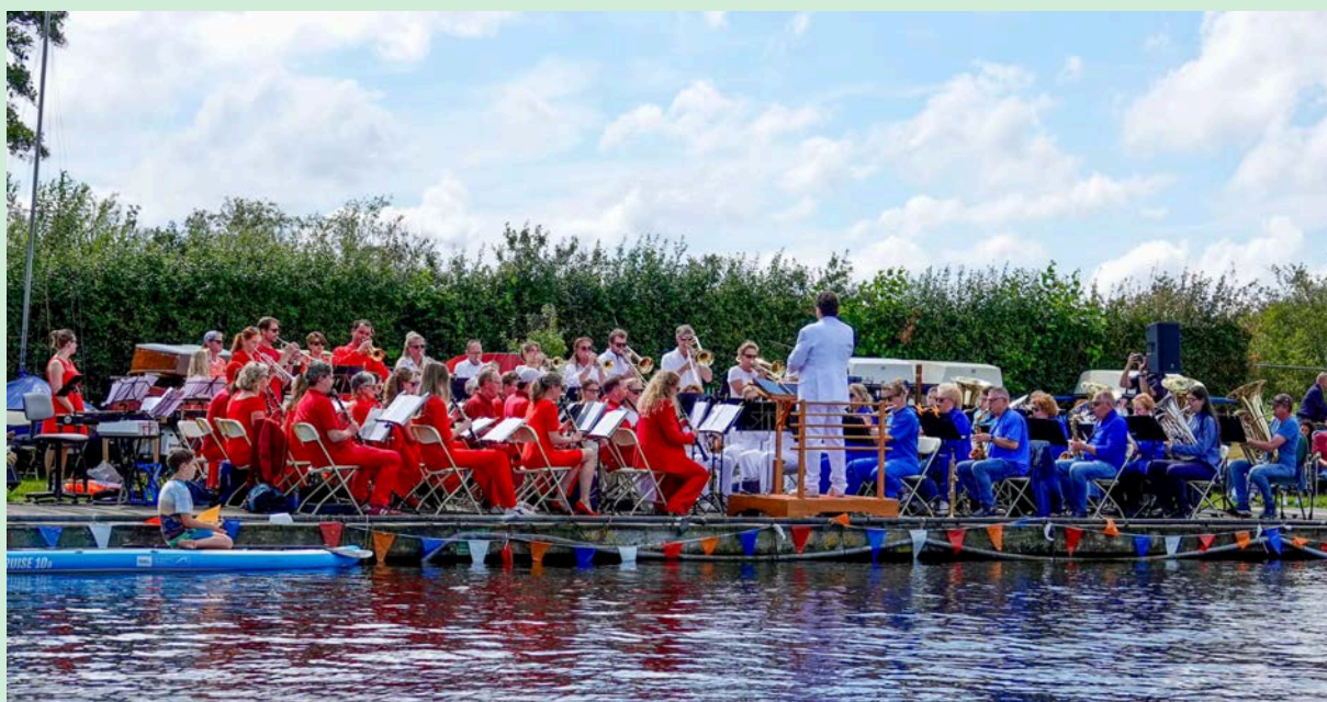
Concert aan het Water 2024